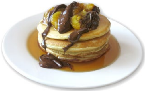
Banana Pancakes 5000 Kyat

with Maple Syrup & Chocolate Sauce ငှက်ပျောသီး ပန်ကိတ်၊ သကြားရည်၊ ချောကလက် ဆော့ပီး။